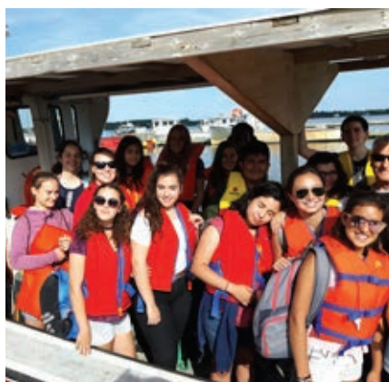
Les élèves ont pris part à de nombreuses activités, dont les festivités du 15 août (à gauche) et une excursion en bateau (à droite).