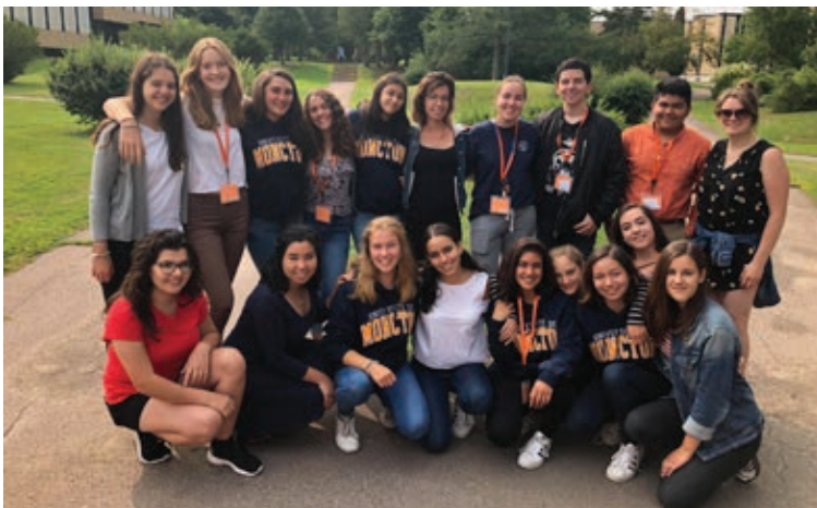
Le groupe d'élèves internationaux qui ont participé au camp d'été 2018 en compagnie des monitrices.