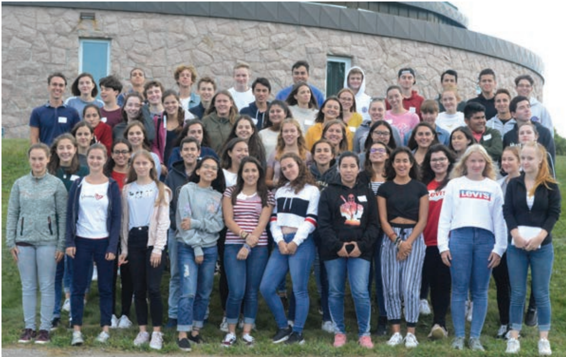
Le groupe qui a participé à l'orientation les 8 et 9 septembre à Bathurst.